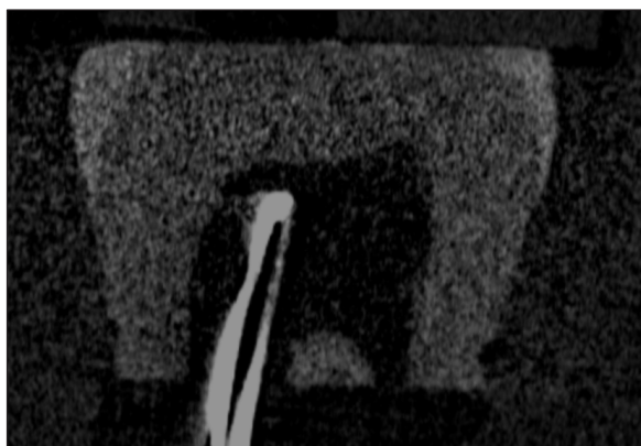
Ryc. 1. Pozycja termopary w obrazie z micro-CT.

odległość pomiędzy termoparą a sklepieniem komory w przekrojach strzałkowym i czołowym. Wartości wynosiły odpowiednio 2,8 mm i 0,35 mm dla przekroju czołowego oraz 2,7 mm i 0,4 mm dla przekroju strzałkowego (ryc. 1). Na powierzchni górnej przygotowanego bloczka dodano matrycę z polietylenu z otworem o wysokości 2 mm i średnicy 3 mm. Pozycja matrycy została ustabilizowana przy pomocy masy silikonowej. Matryca mogła być łatwo wysuwana i wsuwana na swoje miejsce.